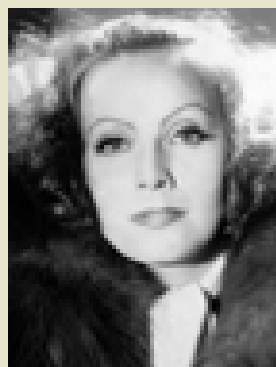
Antike und moderne Diva – Drusilla und Greta Garbo

Als seine Lieblingsschwester Drusilla im Jahre 38 n. Chr. plötzlich starb, tröstete sich Kaiser Caligula mit einem neuen – ihrem – Stern. Aus Iulia Drusilla wur-